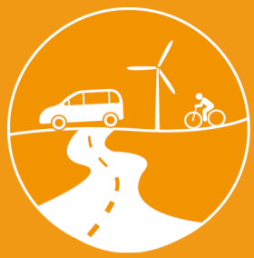
SCHÉMA DIRECTEUR CYCLABLE

DIAGNOSTIC DES ITINÉRAIRES EXISTANTS ET PREMIÈRES HYPOTHÈSES DE MAILLAGE